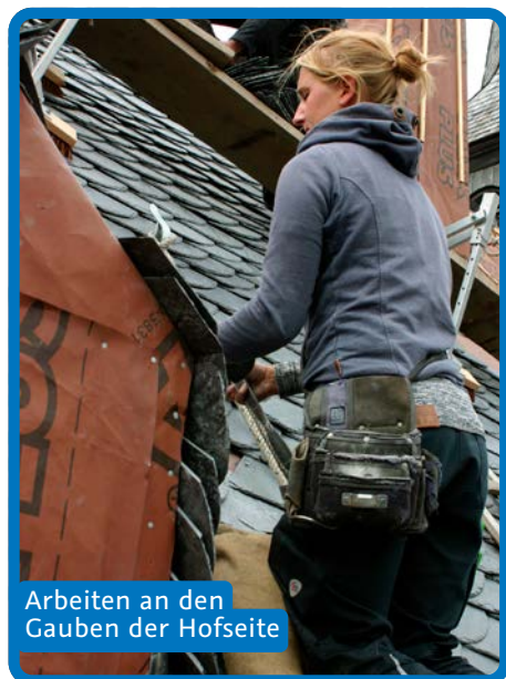
Arbeiten an den Gauben der Hofseite