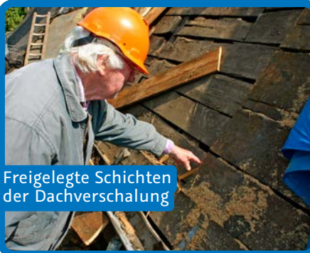
Freigelegte Schichten der Dachverschalung