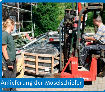
Anlieferung der Moselschiefer