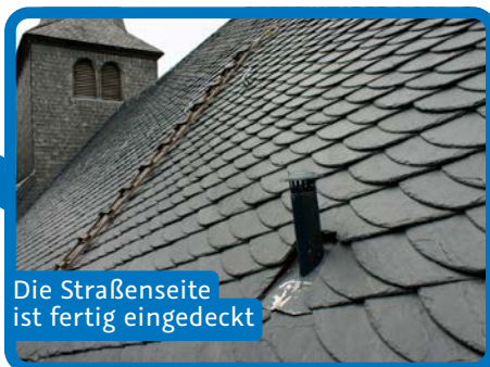
Die Straßenseite ist fertig eingedeckt