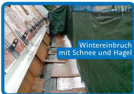
Wintereinbruch mit Schnee und Hagel

Bildergalerien und weitere Informationen zu diesem Projekt sind auf unserer Gemeindefwebseite zu finden unter kzwei.net/6084 . Erich Güttler