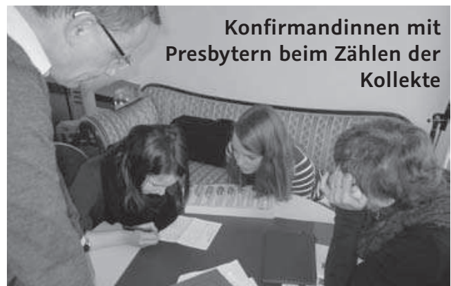
Konfirmandinnen mit Presbytern beim Zählen der Kollekte

bekennnis, Vaterunser, Taufe und Abendmahl) nach Luthers Kleinem Katechismus auseinandergesetzt hatten. Sie schafften es, der Gemeinde Neues oder schon längst Vergessenes auf kurzweilige und anschauliche Weise nahe zu bringen.