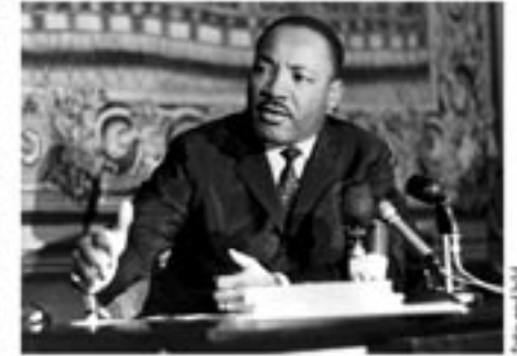
Bürgerrechtler und Pastor Martin Luther King (1929 – 1968)

Keiner, der 1963 den Sternmarsch von einer Viertelmillion Bürgerrechtlern zum Washingtoner Lincoln-Denkmal am Bildschirm miterlebte, wird diese Demonstration für die Gerechtigkeit jemals vergessen können: 250.000 Farbige und Weiße, die anständige Wohnungen, gerechte Löhne und das Ende der Rassentrennung an den Schulen forderten und die alten Spirituals der Negerklaven sangen. Keiner wird den Augenblick vergessen, als der junge Baptistenpfarrer Martin Luther King aus Alabama am Fuß des Lincoln-Denkmal seine Vision von einer guten Zukunft für alle Menschen in den Himmel rief: